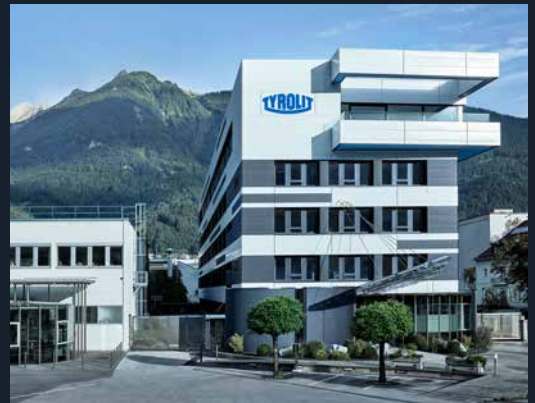
Der TYROLIT Unternehmenssitz in Schwaz, Österreich.

Subscribe our channel youtube.com/TYROLITgroup